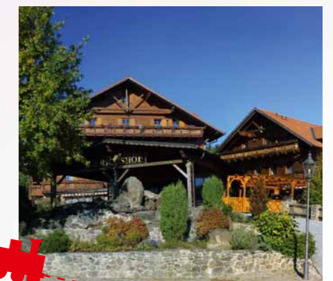
... bietet der Ulrichshof im Bayerischen Wald.

eine Entscheidung erleichtern. Allerdings sollte man auch Familienhotels eine Chance geben, die sich keinem Verband angeschlossen haben.“