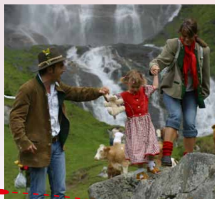
... wie die Natur rund um das Kärntner Hotel.