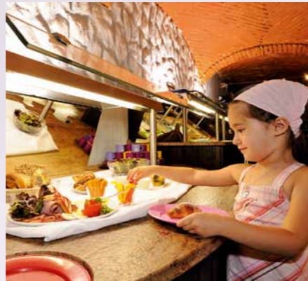
... und gemeinsam mit den Kindern.

wie von technischen Geräten. Außerdem hält die Begeisterung länger an.“ Seine Konsequenz: Im Ulrichshof gibt es unter den Betreuern inzwischen zwei ausgebildete Naturführer. Von einem neuen Trend möchte Katja Senjor von GEO Saison allerdings nicht sprechen. Viele Kinderhotels hätten sich in den vergangenen Jahren gegenseitig hochgeschaukelt, als es um Freizeithighlights wie Kletterwände ging. „Inzwischen haben viele Hoteliers gemerkt, dass weniger mehr ist. Sie fragen sich viel eher, wie sie den Bach integrieren, der sowieso vor dem Hotel entlang fließt“, sagt die Journalistin.