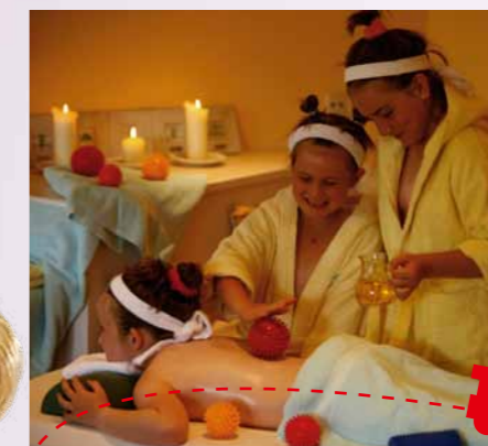
Entspannung für Groß und Klein ...