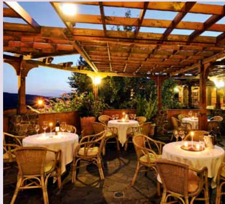
Besonders wichtig im Familienurlaub: Zeit zu zweit ...

wie von technischen Geräten. Außerdem hält die Begeisterung länger an.“ Seine Konsequenz: Im Ulrichshof gibt es unter den Betreuern inzwischen zwei ausgebildete Naturführer. Von einem neuen Trend möchte Katja Senjor von GEO Saison allerdings nicht sprechen. Viele Kinderhotels hätten sich in den vergangenen Jahren gegenseitig hochgeschaukelt, als es um Freizeithighlights wie Kletterwände ging. „Inzwischen haben viele Hoteliers gemerkt, dass weniger mehr ist. Sie fragen sich viel eher, wie sie den Bach integrieren, der sowieso vor dem Hotel entlang fließt“, sagt die Journalistin.